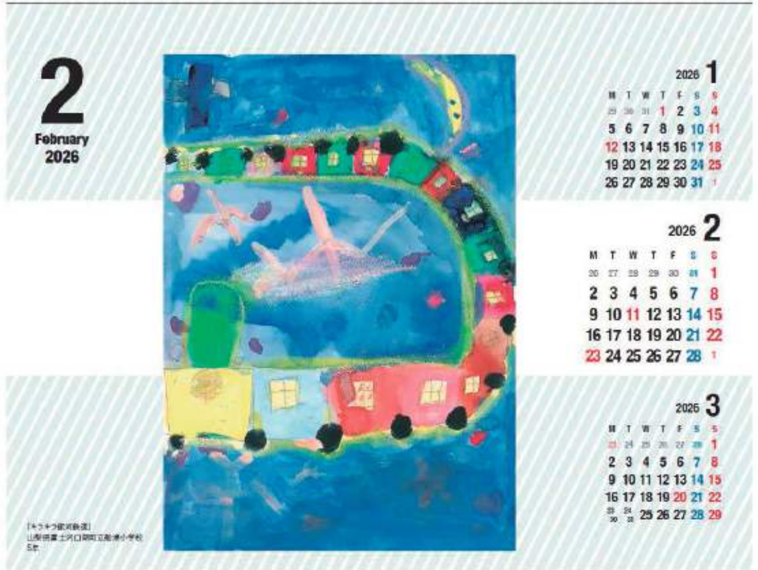
『キラキラ銀河鉄道』