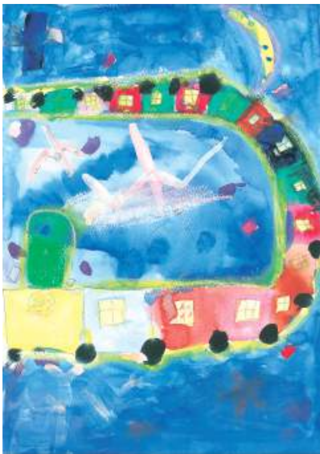
「キラキラ銀河鉄道」

12月8日に、山梨支部役員が船津小学校におうかがいし、クラスの皆さんの前で賞状と記念品を授与してきました。後日、全校集会の折りに、校長先生より再度表彰をしていただきました。また、この夢カレンダーを全クラスに配布して、全員で栄光を称えてくださいました。