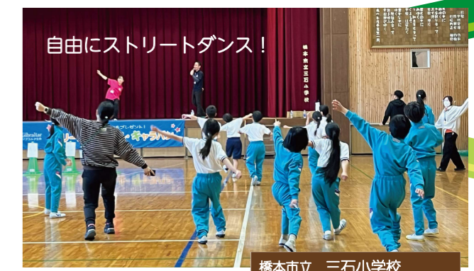
橋本市立 三石小学校 ジブラルタ生命 ドリームスクールキャラバン