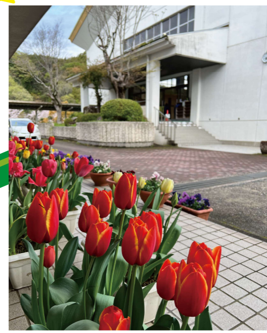
今年もきれいに咲きました！ 田辺市立 上秋津中学校 夢いっぱいチューリップ球根プレゼント