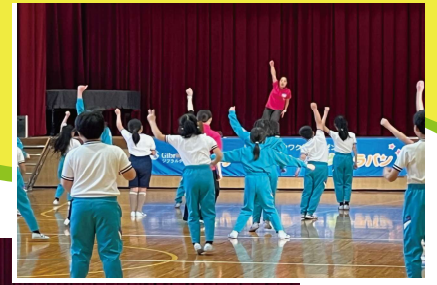
橋本市立三石小学校