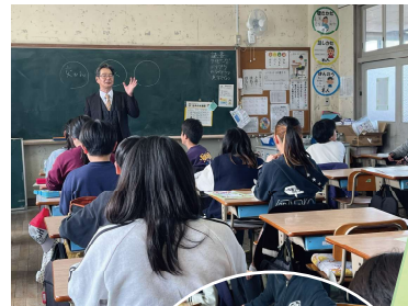
和歌山市立木本小学校 2026年2月5日