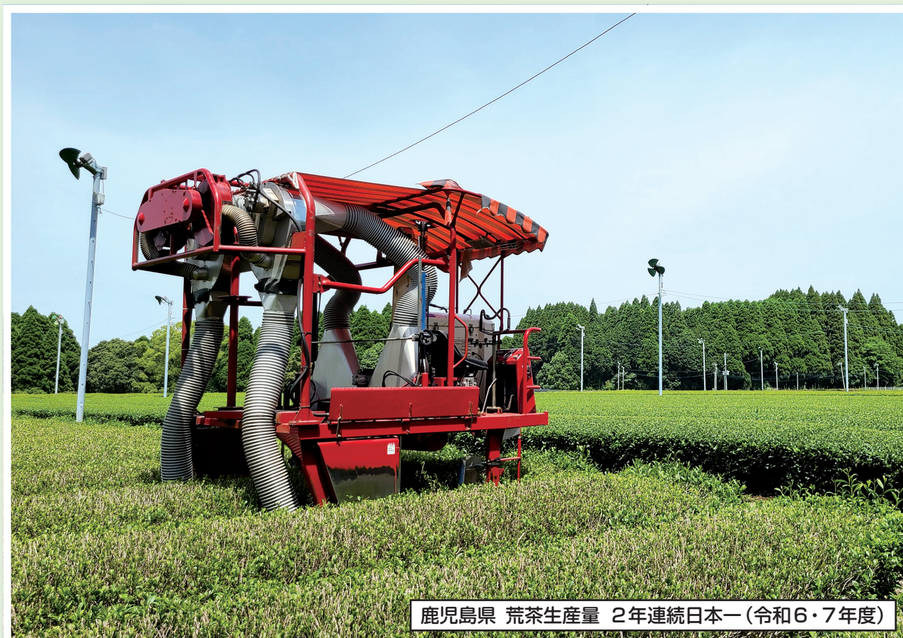
鹿児島県 荒茶生産量 2年連続日本一(令和6・7年度)